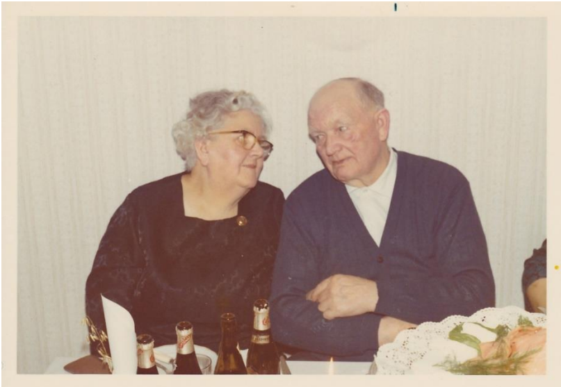
Guldrudeparret den 29. januar 1972

Den 29. januar 1972 blev deres guldbryllup fejret med en stor og vellykket fest, der blev holdt i deres lille 2-værelses lejlighed på Padborgvej 6, 2. th. To dage senere skulle jeg ind som soldat. Sang og billeder haves. Det var så koldt, så de hyrede hornblæsere ikke kunne få gang i hornene udenfor. Først da de kom ind i opgangen fik de tøet hornene op, og guldrudeparret og deres gæster fik en fin fanfare.