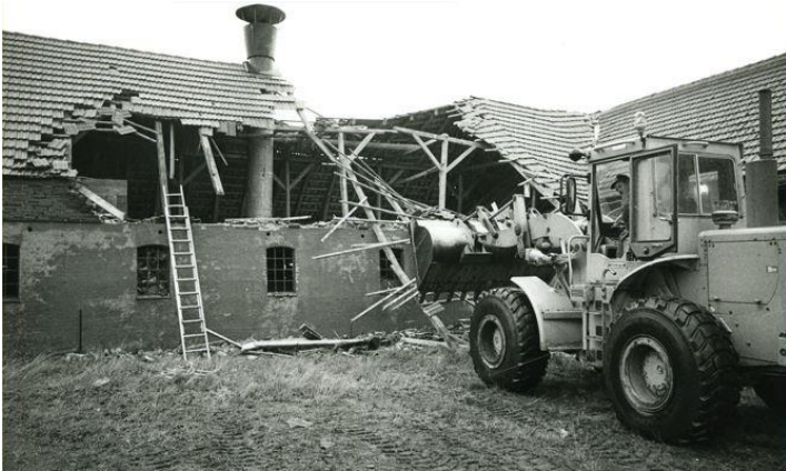
Fattiggården i Wåde nedrives i 1982