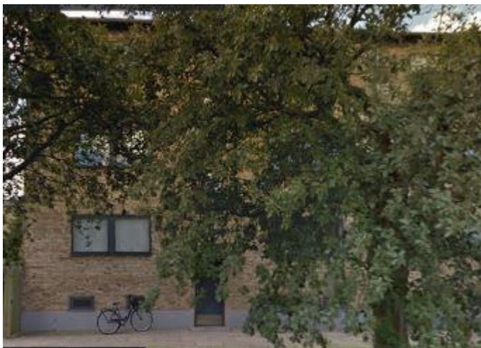
Padborgvej 6.

1950 – 1979: Padborgvej 6, 2. th., Rødovre