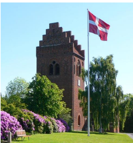
Brøndbyvester Kirke.