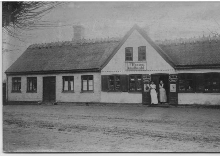
Købmandsbutikken i Brøndbyvester -