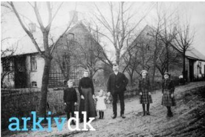
Dorthealyst omkr 1920.