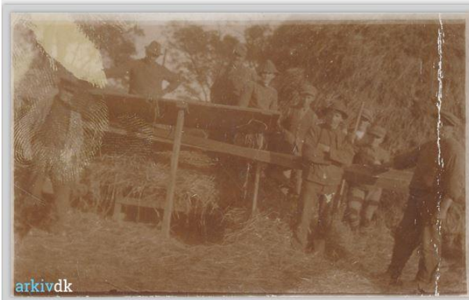
Vitvedgård 1920. Fra Arkiv.dk

Omrejsende damptærsker på besøg på Vitvedgaard til tærskning af hæs. Personerne er ukendte