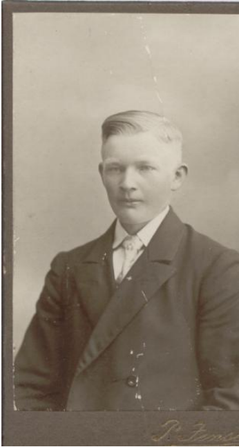
Morfar som ung