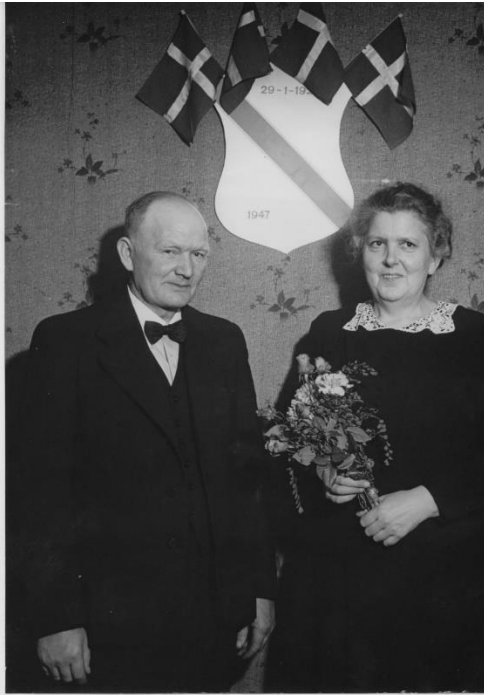
Sølvbryllupsparret den 29. januar 1947