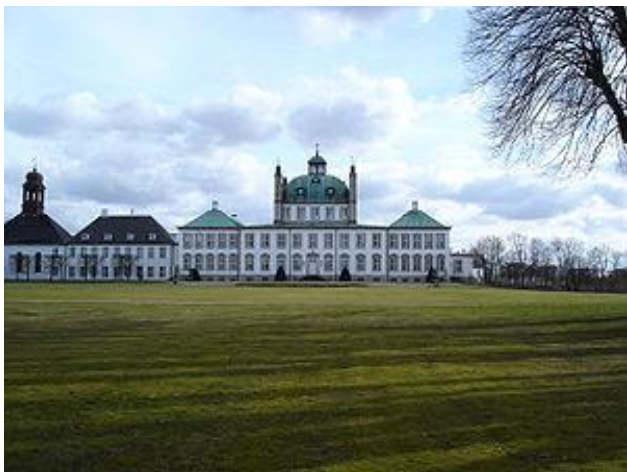
Fredensborg slot med Slotskirken og kirketårnet ude til venstre.

I 1822 var familien flyttet til Fredensborg, og han var assistent ved Fredensborg Slotskirke.