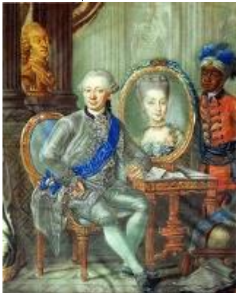
Heinrich Carl Schimmelmänn med sort tjener.