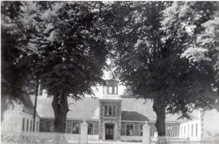
Urbanslyst.