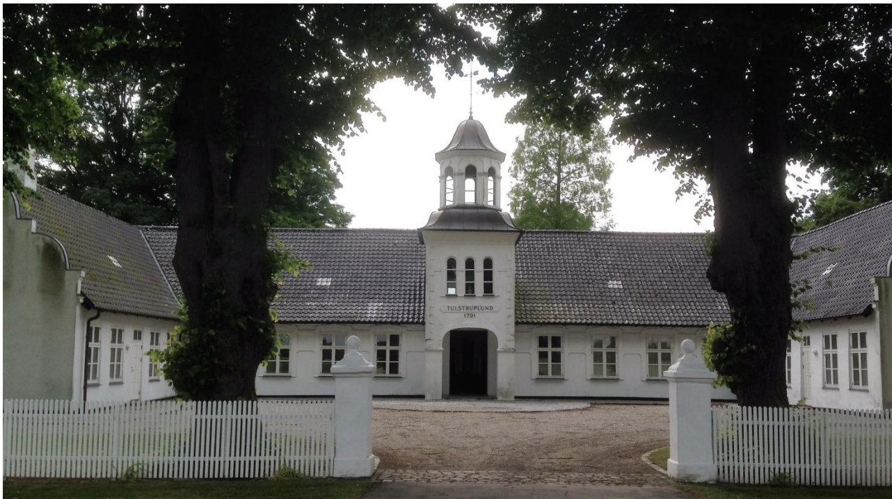
Urbanslyst, nu kaldet Tulstruplund 2016.